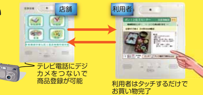
テレビ電話にデジカメをつないで商品登録が可能

外出や重いものを持ち運ぶことが困難な高齢者にもタッチパネル画面から簡単に注文が行えます。